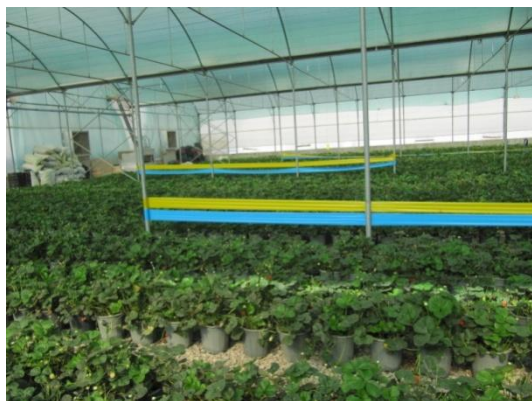
شکل ۹) نصب نوارهای رنگی برای شکار بخشی از جمعیت آفت

چشم بماند. امروزه با نصب تله‌های نواری در گلخانه‌ها سعی در کاهش جمعیت آفت می‌کنند (Roll, 2004) (شکل ۹).