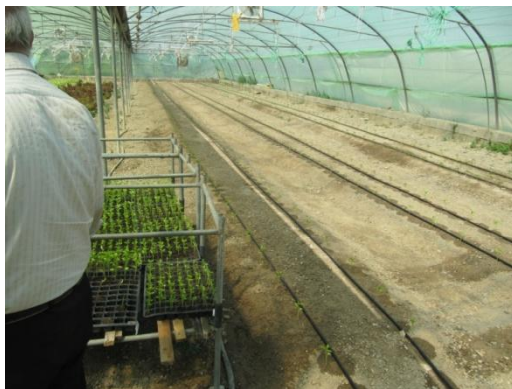
شکل ۱۳) محل قرار دادن سینی‌های نشاهای آماده کشت

اطمینان از سلامت و عاری بودن از آلودگی در محل اصلی قرار داده شوند. در غیر این صورت بهتر است محل گیاهان جدید مشخص گردد تا آلودگی احتمالی تحت نظر باشد (شکل ۱۳).