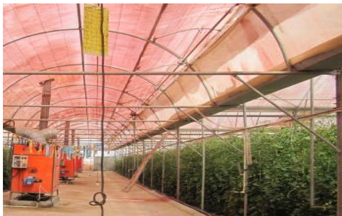
شکل ۶) سیستم گرمایشی در راهروی وسط گلخانه

این شرایط در فصول گرم نیز باید با نصب سیستم مناسب خنک کننده‌ها (از جمله سیستم فن و پد) رعایت شود (شکل ۷).