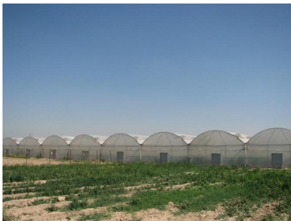
شکل ۱) یک مجتمع گلخانه‌ای شامل چندین واحد

استفاده از ابزار و تکنولوژی مناسب در ساختار و احداث گلخانه‌ها برای موفقیت یک برنامه کنترل غیرشیمیای آفات بسیار مهم می‌باشد. محاسبات دقیق در طراحی قسمت‌های مختلف (محل در ورودی و دریچه‌ها) و دقت در نصب بدنه اصلی گلخانه، نه تنها در صرفه جویی انرژی، بلکه در جهت پاکیزه بوده محیط گلخانه و جلوگیری از نفوذ آفات بسیار مفید است (Sapounas et al. , 2010). ابعاد گلخانه‌ها بسته به امکانات و هدف مورد نظر، ممکن است بسیار بزرگ باشد که معمولا با طراحی چندین واحد در کنار هم ایجاد شده و سقف آنها به صورت چند قوسی دیده می‌شوند (شکل ۱).