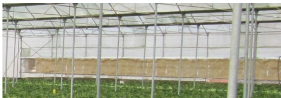
شکل ۷) نصب سیستم فن (بالا) و پد (پائین) در گلخانه‌ها