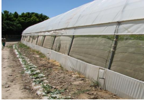
شکل ۵) توری معمولی که برای جلوگیری از ورود حشرات کامل بید گوجه‌فرنگی مفید است

البته با نصب توری‌ها جریان هوا کم و تهویه گلخانه دچار مشکل می‌گردد. برای رفع این مشکل باید ابعاد دریچه‌ها را بزرگتر در نظر گرفت، بطوریکه سطح دریچه با توری (با منافذ ریز) سه برابر سطح دریچه بدون توری باشد. در مورد فن‌ها و پدها (که تغییر در ابعاد آنها مشکل است)، تعبیه یک محفظه بر روی آنها و نصب توری در اطراف آن می‌تواند در سهولت جریان هوا موثر باشد. استفاده از توری ضد حشره در برخی از کشورها که دمای هوا برای کشت در طول سال مساعد است (مانند اسپانیا و مراکش) بجای پوشش پلاستیکی برای تمام سطح دیواره‌ها (و حتی تمام سطح) گلخانه‌ها نیز استفاده می‌گردد. استفاده از این نوع پوشش در مناطق جنوبی ایران (جیرفت یا چابهار) نیز قابل بررسی و توصیه می‌باشد. باید در نظر داشت که توری‌های نصب شده باید بطور منظم مورد بازدید قرار گرفته و در صورت وجود درز و شکاف نسبت به ترمیم آن اقدام کرد. در مقابل بسته شدن منافذ توری‌ها به وسیله گرد و خاک که مانع از تهویه مناسب