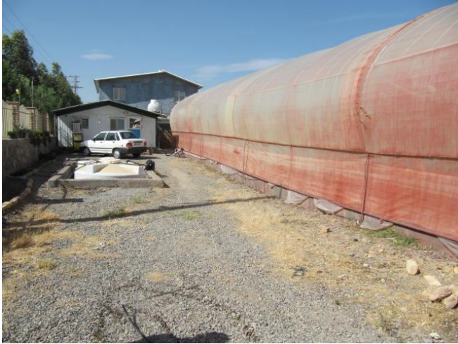
شکل ۱۱) فضای کنار گلخانه که عاری از هر نوع گیاه در نظر گرفته می‌شود