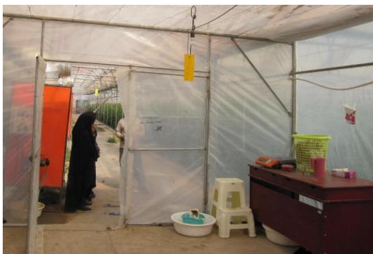
شکل ۳) ورودی اصلی گلخانه (بالا)، در داخلی (پایین).