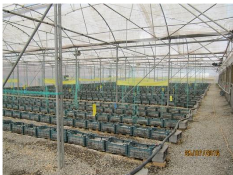
شکل ۱۲) خالی نگه داشتن گلخانه یک هفته قبل از کشت