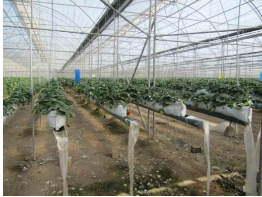
شکل ۸) تله‌های رنگی نصب شده برای پایش جمعیت آفات در گلخانه توت‌فرنگی

این نوع تله‌ها اغلب برای پایش جمعیت آفات و مشخص کردن روند کنترل آن مورد استفاده قرار می‌گیرند. تله‌ها باید بطور هفتگی مورد بازمینی قرار گرفته و در صورت نیاز، تعویض شوند تا روند جمعیت آفات مورد نظر بهتر مشخص گردد. به علاوه گاهی نحوه نصب تله در جلب بهتر آفات مهم است. مثلاً مگس‌های مینوز بیشتر در تله‌هایی که بطور افقی نصب شوند، گرفتار می‌شوند. در حالیکه افقی و یا عمودی بودن تله در جذب سفیدبالک‌ها کمتر تاثیر دارد.