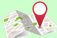
موقعیت روی نقشه

نشانی: ماهیدشت - رباط - جنب مرکز خدمات کشاورزی دولتی