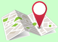
موقعیت روی نقشه